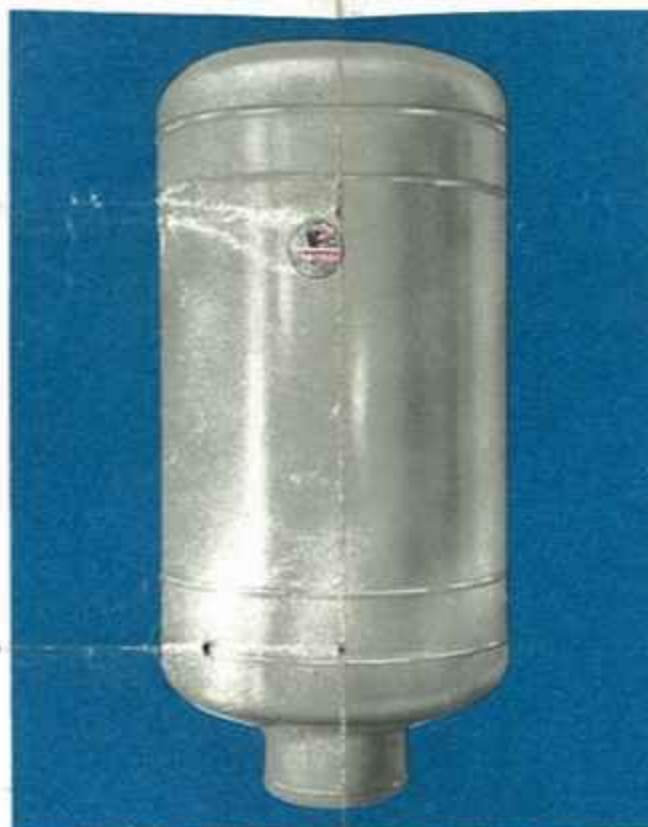
TYPE VERTICAL — Essai 15 kg.